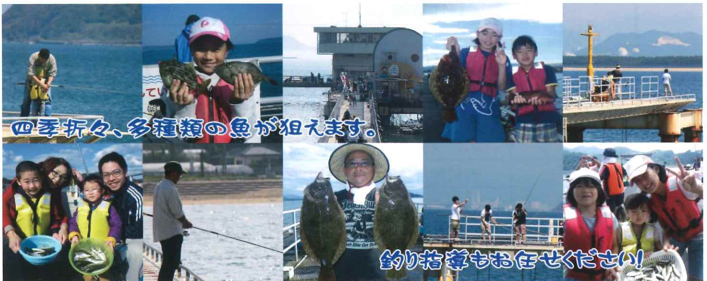
四季折々、多種類の魚が狙えます。

10名様以上より団体割引がございます。 年間を通じて10%割引にてご利用できます。(要予約) 裏面の申込書をご利用ください。